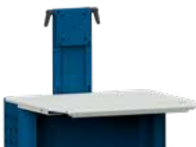
Monitorhalter nach VESA MIS-D 75/100