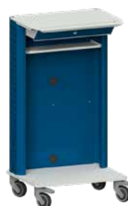
Basiswagen mit abschließbarem Laptop-/Tablet-PC-Fach unter der Arbeitsplatte