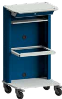
Basiswagen mit abschließbarem Laptopfach unter der Arbeitsplatte und Hängeregistraturrahmen für DIN A4