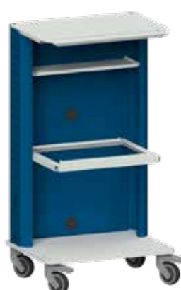
Basiswagen mit Hängeregistraturrahmen für DIN A4