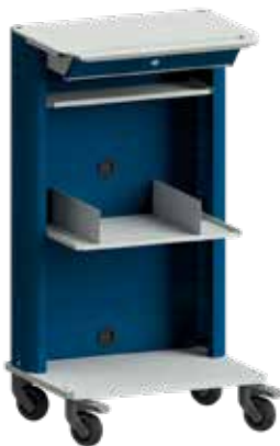
Basiswagen mit abschließbarem Laptop-/Tablet-PC-Fach und Ablage inkl. Buchstützen