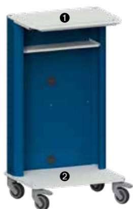
Basiswagen (Tastaturablage inkl.)