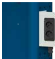
Steckdosenleiste mit 2 x Schuko 230 V