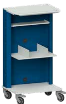
Basiswagen mit zusätzlicher Ablage und 2 Buchstützen